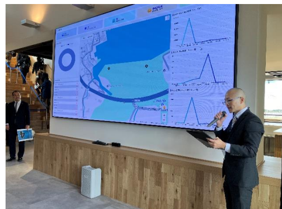
▲オフィス棟見学の様子。現在開発中の運行管理システムをモニターに投影しています。車両の現在位置やトラブル、充電残量の車両情報を遠隔で監視することができます。