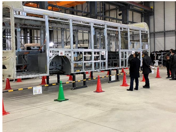
▲組み立てライン見学の様子。(左) AGVのデモンストレーションの様子 (右) 工場内で組立を行ったスケルトンボディ (車軸の骨格)。組立ラインではボルトリベット接着工法を採用し、溶接レスを実現。