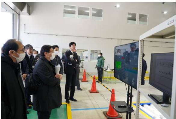
◀空間 GPS 見学の様子。高精度なセンサーにより三次元の位置情報。人・物の位置情報の見える化による現場の進捗管理、ねじの高精度締め付けツールとの連携による締め付け証明の実現等、作業改善を実現。