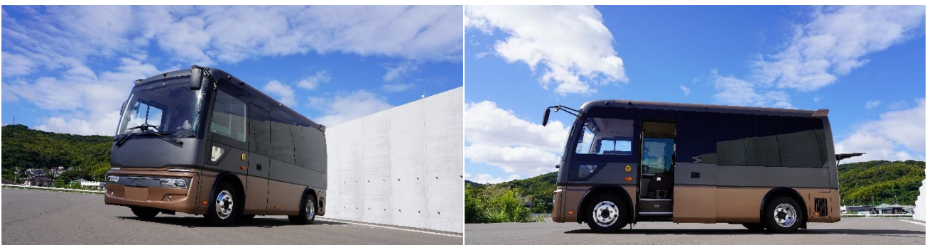
※写真は 5.99m EVマイクロバス