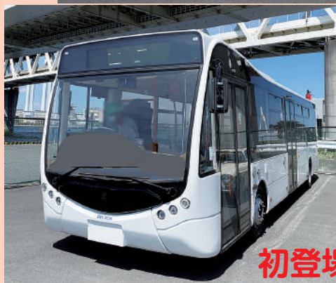
←Switch メトロシティ 10.8m 大型電気バス