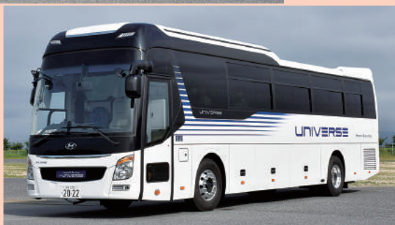
↓現代ユニバス 観光仕様・AT車

展示車はほかに、三菱ふそうエアロエース(リニューアルサンプル車)、三菱ふそうローザ観光仕様、ジャパン21からモービルアイ・シールドプラスほか先進安全機器搭載車、丸菱工業からフリーデザイン・シートカバー装着車、さらに首都圏事業者から最新バスが参加します。