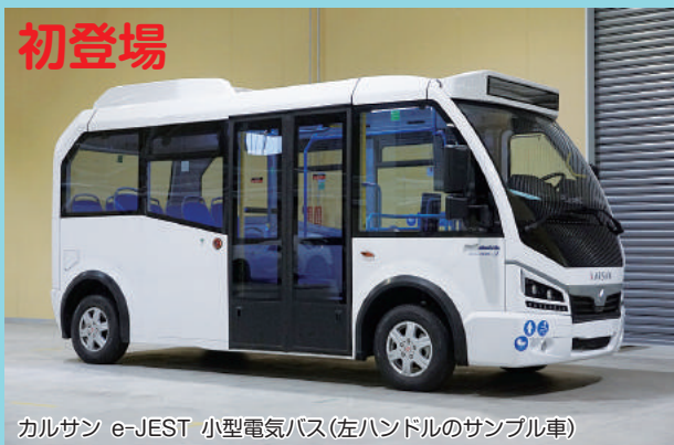
カルサン e-JEST 小型電気バス(左ハンドルのサンプル車)