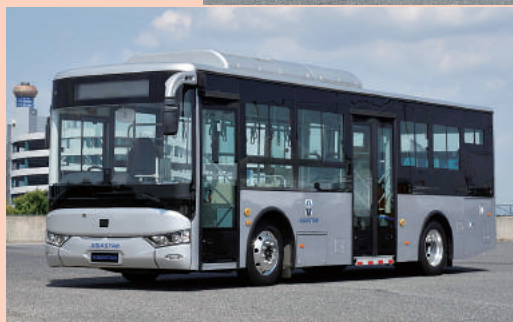
←アジアスター ジャパン オノエンスター EV (車型未定)