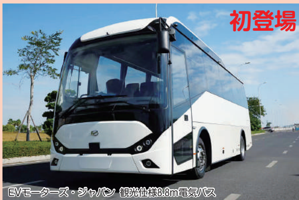
EVモーターズ・ジャパン 観光仕様8.8m電気バス