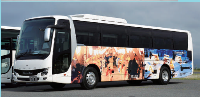
↑三菱ふそうエアロエース 13列・ポデプリント車