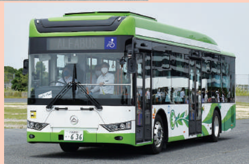
→アルファバス E-CITY L10 大型電気バス