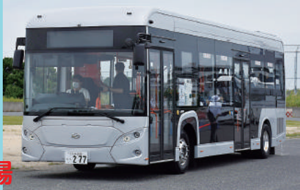
→EVモーターズ・ジャパン 10m級大型電気バス